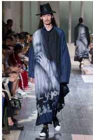
Figure 10. 발묵법 패션디자인 1. From Vogue Magazine. (n.d.). https://www.pinterest.com