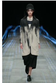
Figure 11. 발묵법 패션디자인 2.