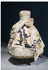
Figure 15. 적묵법 패션디자인 3. From Lisa Richardson. (n.d.). http://www.pinterest.co.kr

많이 사용되며, <Figure 10-12>와 같이 먹을 쏟거나 뿌려서 표현 효과를 주는 발묵(潑墨)법도 자주 사용된다. 꽃이나 풍경의 사실적인 묘사를 적용한 패션디자인에서는 <Figure 13-15>와 같은 적묵(寂墨)법을 주로 사용한다(Huang, 2009).