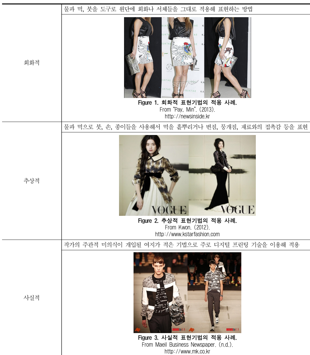
Table 1. Expression technique of ink.

의 표현에서 주로 나타났다(Kim, 2016). 이는 ‘선과 형태, 색과 구도 그리고 공간, 절제된 표현성, 여백의 활용, 운율, 필선의 변화’의 7가지 요소로 정리할 수 있다(Min, 2018).