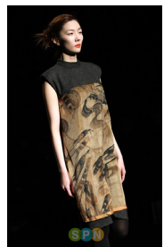
Figure 13. 적묵법 패션디자인 1. From Kim. (2011). http://www.edaily.co.kr