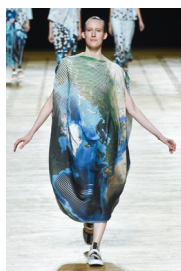
Figure 4. 윤필법 패션디자인 1.

수묵의 기법을 적용하기 위한 붓의 쓰임은 <Figure 4-6>과 같이 윤필(潤筆)법이 많이 나타난다. 윤필법을 이용해 자연스럽게 번지는 꽃잎이나 속도감 있는 선의 효과를 표현한 경우가 가장 많고, 추상 패턴이나 면을 분할 하여 넓은 면적에 거친 표면 효과를 강조한 예도 있다. 먹의 쓰임은 <Figure 7-9>와 같이 먹을 덧칠하는 파묵(破墨)법이 가장