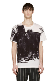
Figure 8. 파묵법 패션디자인 2.