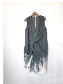
Figure 18. 디자인 제안 3. (November 7, 2020).