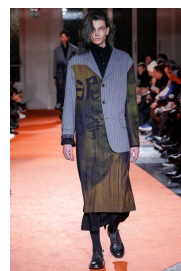
Figure 6. 윤필법 패션디자인 3.