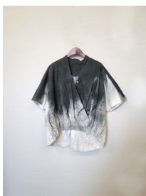
Figure 17. 디자인 제안 2. (November 7, 2020).