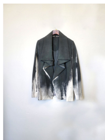
Figure 19. 디자인 제안 4. (November 7, 2020).