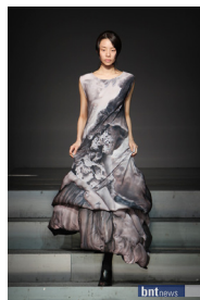
Figure 14. 적묵법 패션디자인 2. From Son. (2011). http://www.hankyung.com