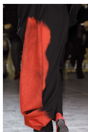
Figure 5. 윤필법 패션디자인 2.