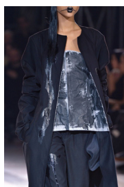
Figure 7. 파묵법 패션디자인 1.