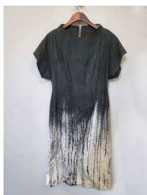
Figure 16. 디자인 제안 1. Photographed by the author. (November 7, 2020).

다음의 <Figure 16-21>은 완성된 의상 6벌의 사진으로 모두 상의로 제작했으며, 재킷과 원피스, 조끼 등의 여러 아이템을 적절하게 조합해서 하나의 컬렉션처럼 보일 수 있도록 했다. 입체와 평면을 모두 사용한 병용식 패턴을 이용해서 완성 의상을 먼저 제작했으며, 그 위에 분무기로 전체가 충분히 적셔질 수 있도록 분무해서 소재가 먹을 잘 흡수할 수 있도록 사전 작업을 진행했다. 그 후 옷걸이에 의상을 걸고 수묵화용 대(大) 붓으로 위