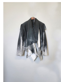
Figure 21. 디자인 제안 6. (November 7, 2020).