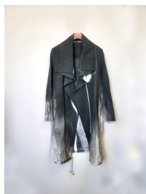
Figure 20. 디자인 제안 5. (November 7, 2020).