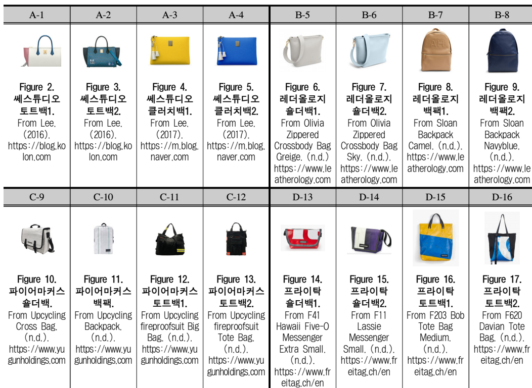
Table 5. 가방의 사회적 디자인 32개 사례.