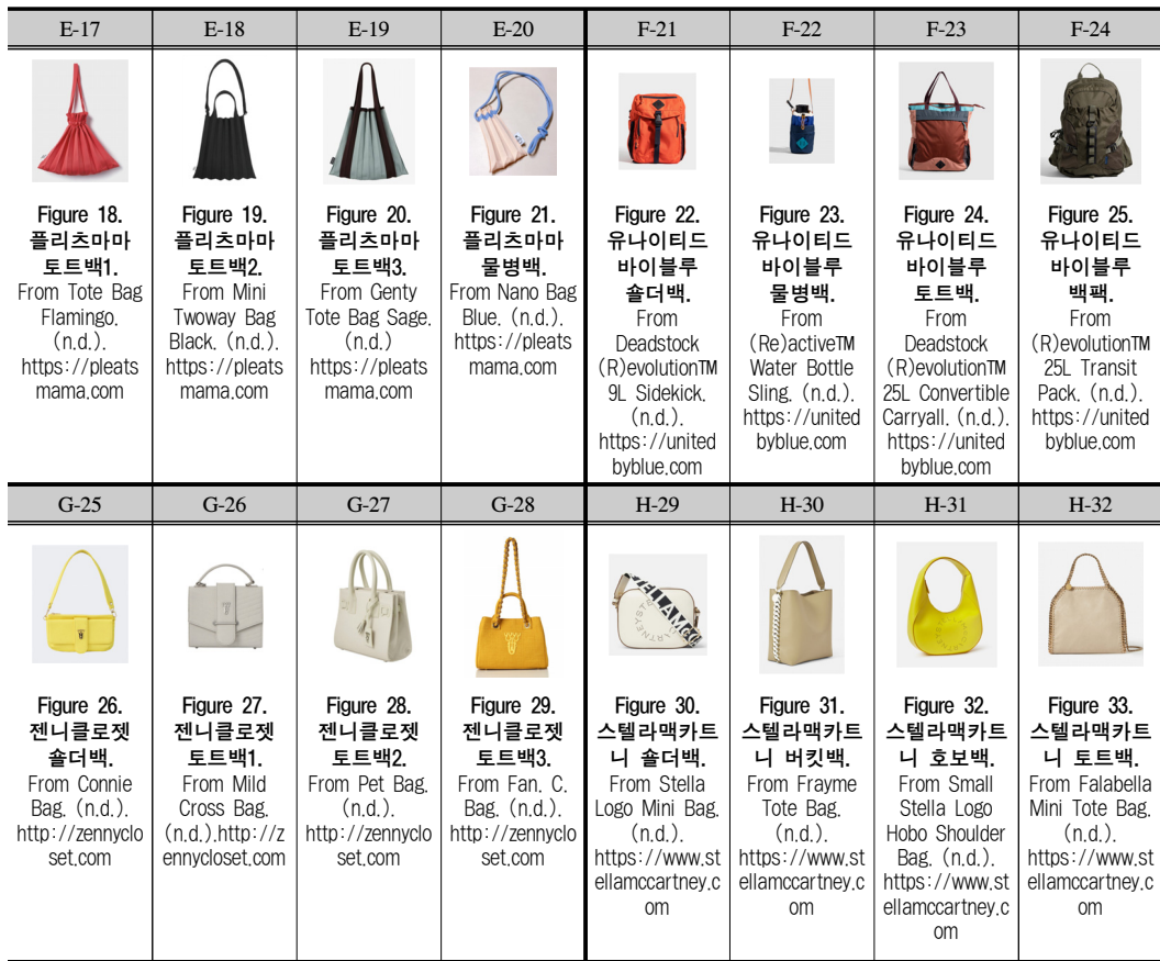
Table 6. 가방의 디자인 씽킹 적용평가 결과.